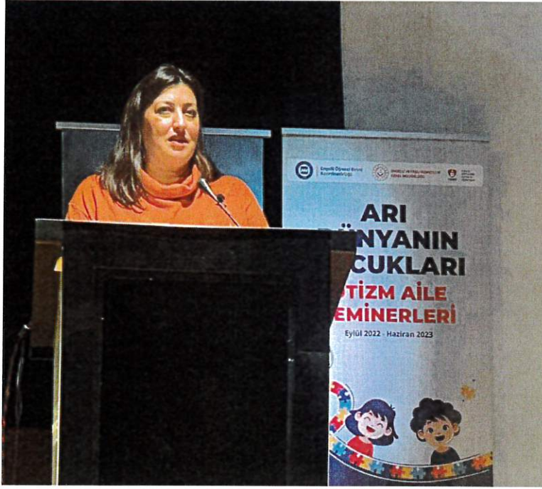
Arı Dünyanın Çocukları 'Otizm Aile Seminerleri'nin 2. dönem 3. semineri "Otizmli Kardeşim ve Ben"