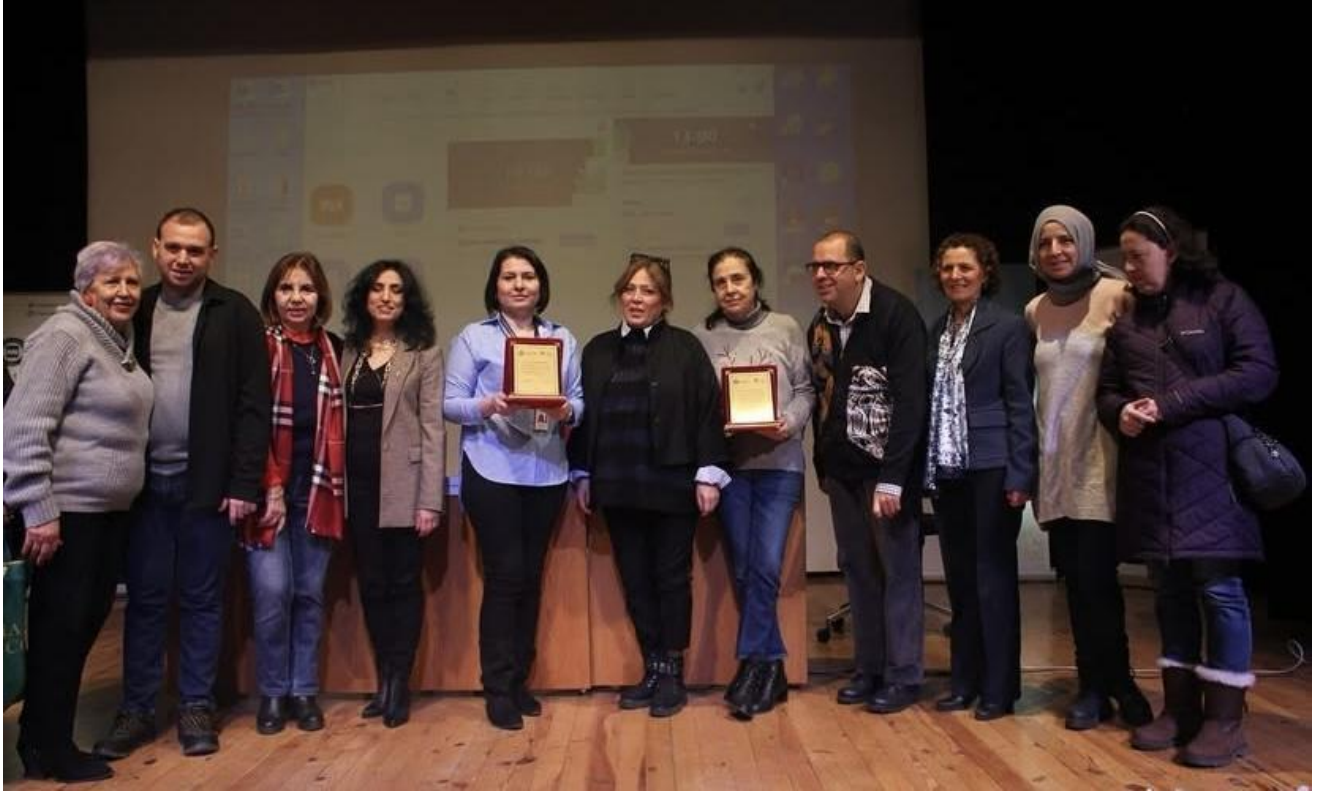
30 Ocak 2024 - Arı Dünya Çocukları: Otizmlü Bireylerde Kriz Yönetimleri, İlk Yardım Ve Otizmlü Güvenlikli Ev Başlıklı Seminer