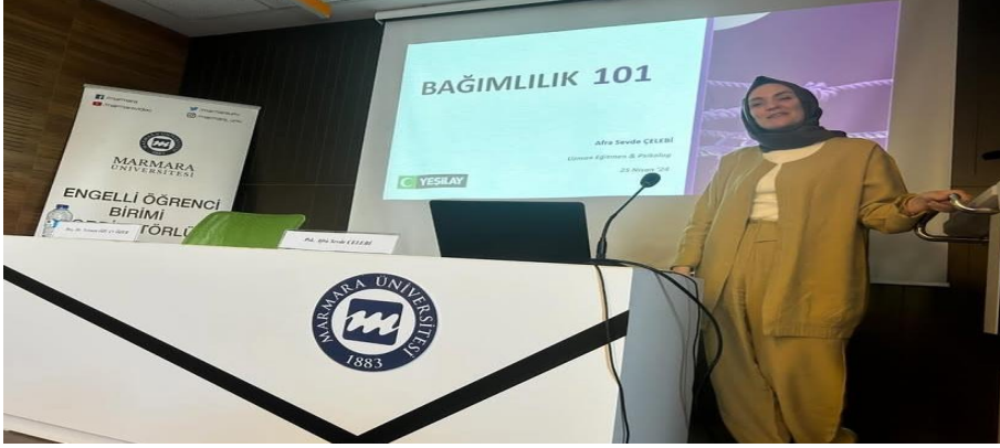
25 Nisan 2024 - Öğretmenlik Adanmışlıktır Paneli -Bağımlılık