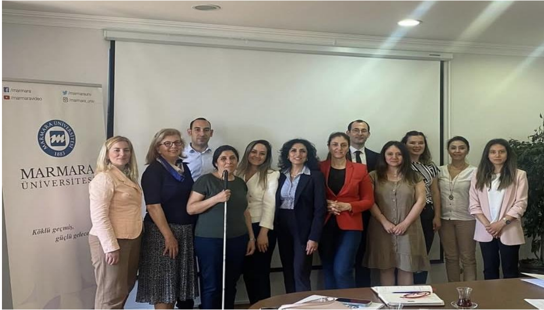
31 Mayıs 2024 - 4.Engelli Kadınların Sosyal Hayata Katılımı ve İstihdamı Çalıştayı