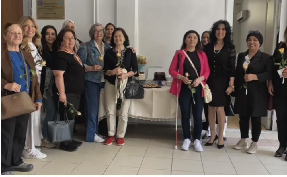
21 Mayıs 2024 -Özel Annler Paneli