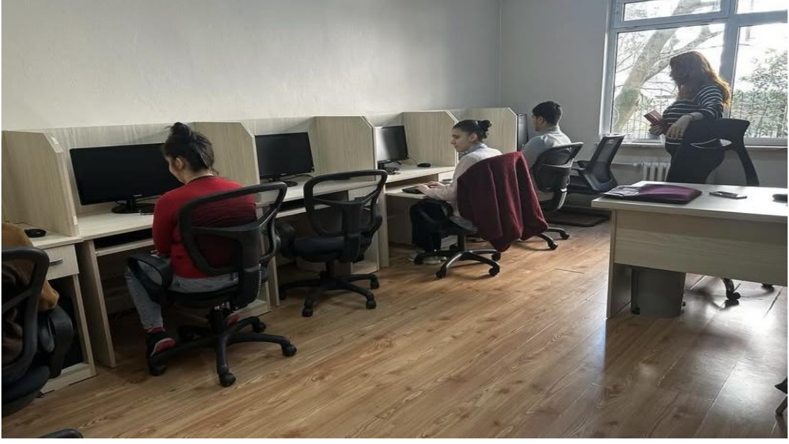
4 Mart 2024 - Altı Nokta Körler Vakfında Katiplik ve Nitelikli Personel Meslek Eğitim Kursları