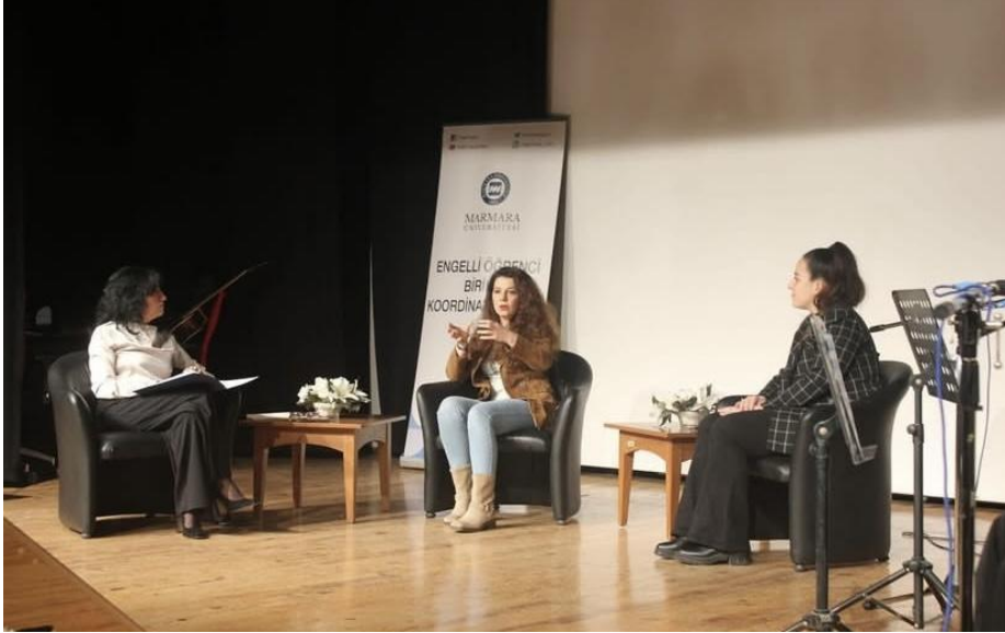
26 Mart 2024 - Aşık Veysel Şatıroğlu' nu Anma Programı- Torunlarıyla Söyleşi