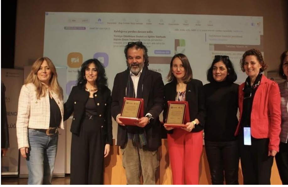
26 Mart 2024 - Arı Dünyanın Çocukları Otizm Aile Seminerlerinin 6.sı olan “Otizmde Takıntı” Semineri