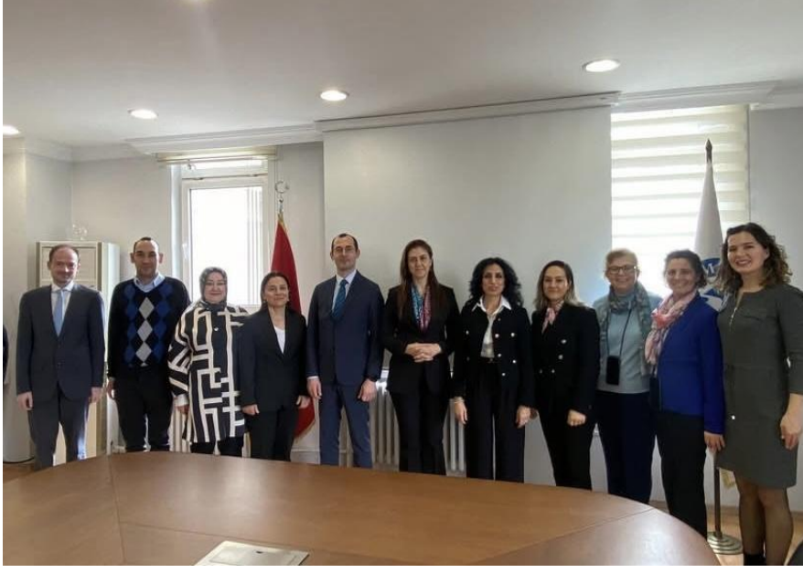
28 Mart 2024 - Engelli Kadınların Sosyal Hayata Katılımı ve İstihdamı çalıştayının