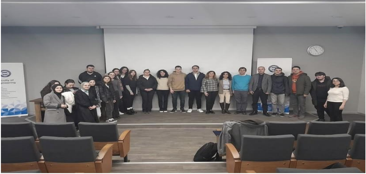
25 Mart 2024 - Teknoloji, Bilişim ve Erişilebilirlik Paneli