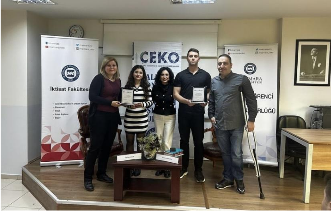
29 Nisan 2024 - Kota Sistemi Paneli