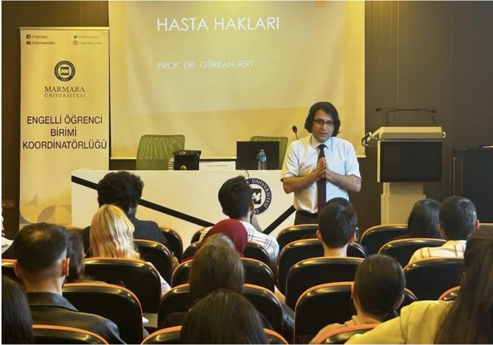
16 Mayıs 2024 - Öğretmenlik Adanmışlıktır Paneli