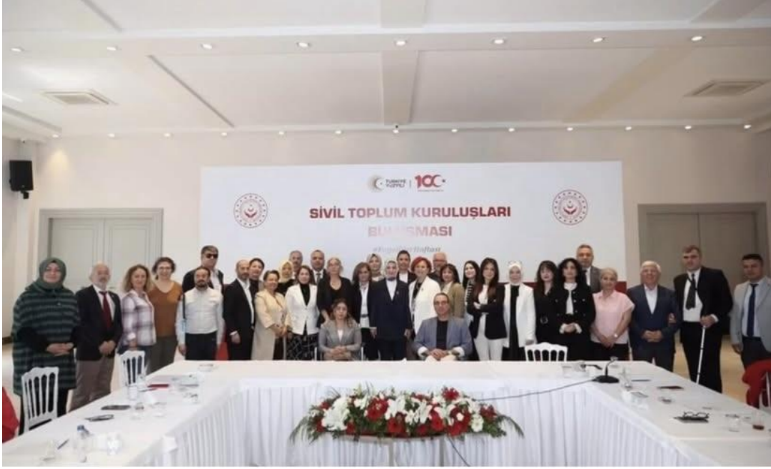
14 Mayıs 2024 - Sivil Toplum Kuruluşları Buluşması