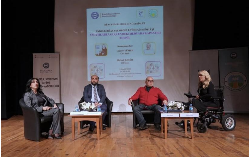
2 Aralık 2024 - Dünya Engelliler Günü Etkinliği: Engelleri Aşanlar Ödül Töreni Ve Söyleşi