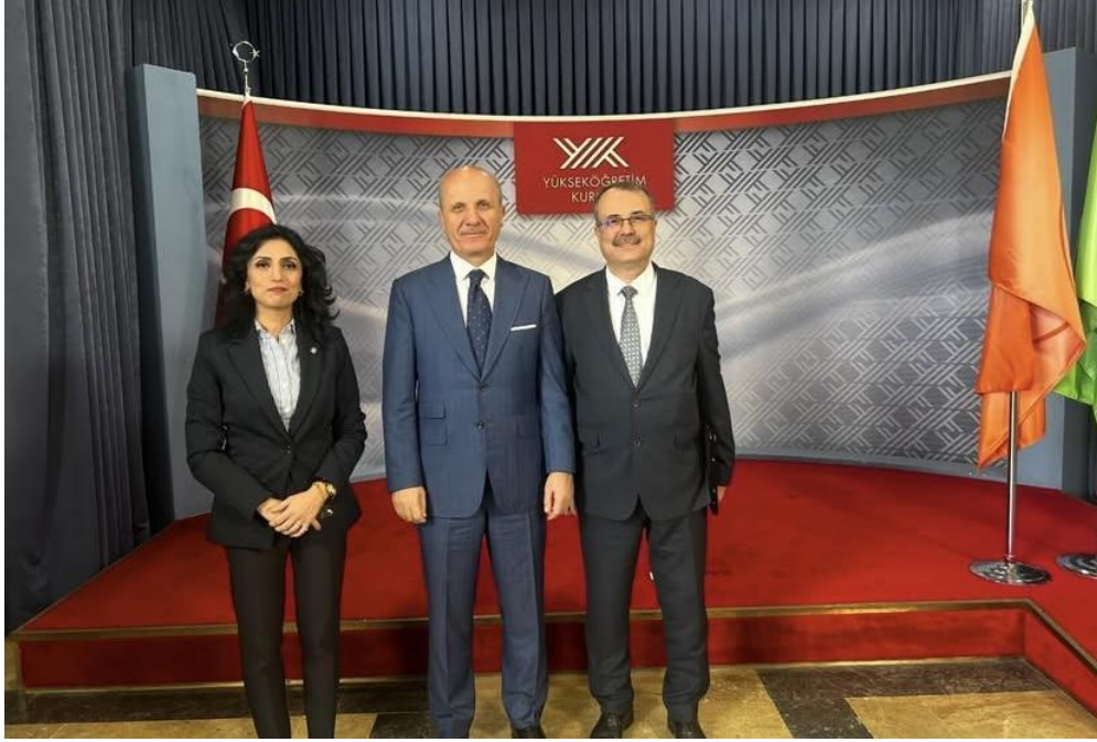
6 Haziran 2024 - Bayrak Ödülleri Töreni