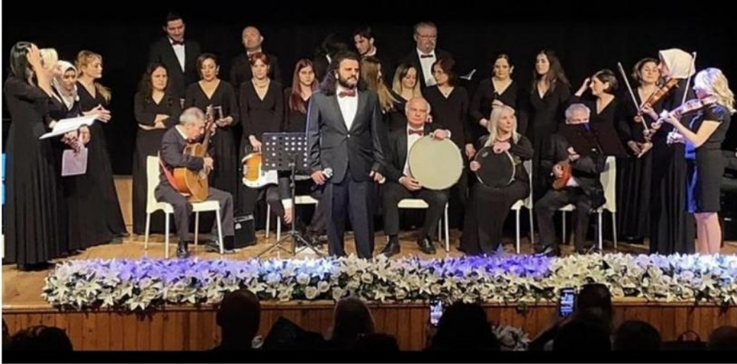
13 Mayıs 2024- Odeon Çoksesli Koro Konseri