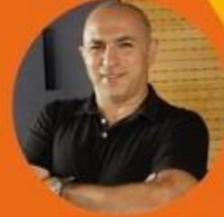
AYHAN AKTAŞ NTV Radyo Programcı ve Sunucu