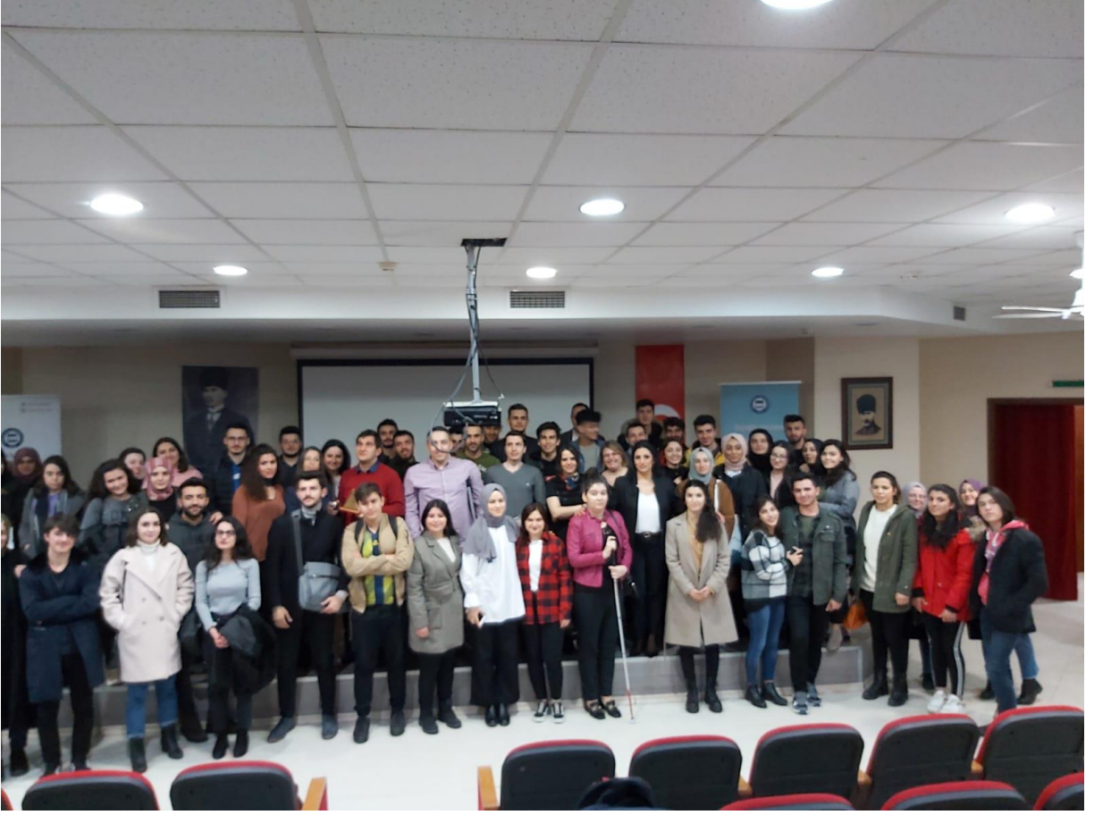
3.Fotoğraf “Önyargının Öncüsü Sağlamcılık” Konferansından