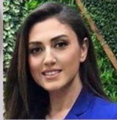
ESKAR MERKEZİ MÜDÜRÜ