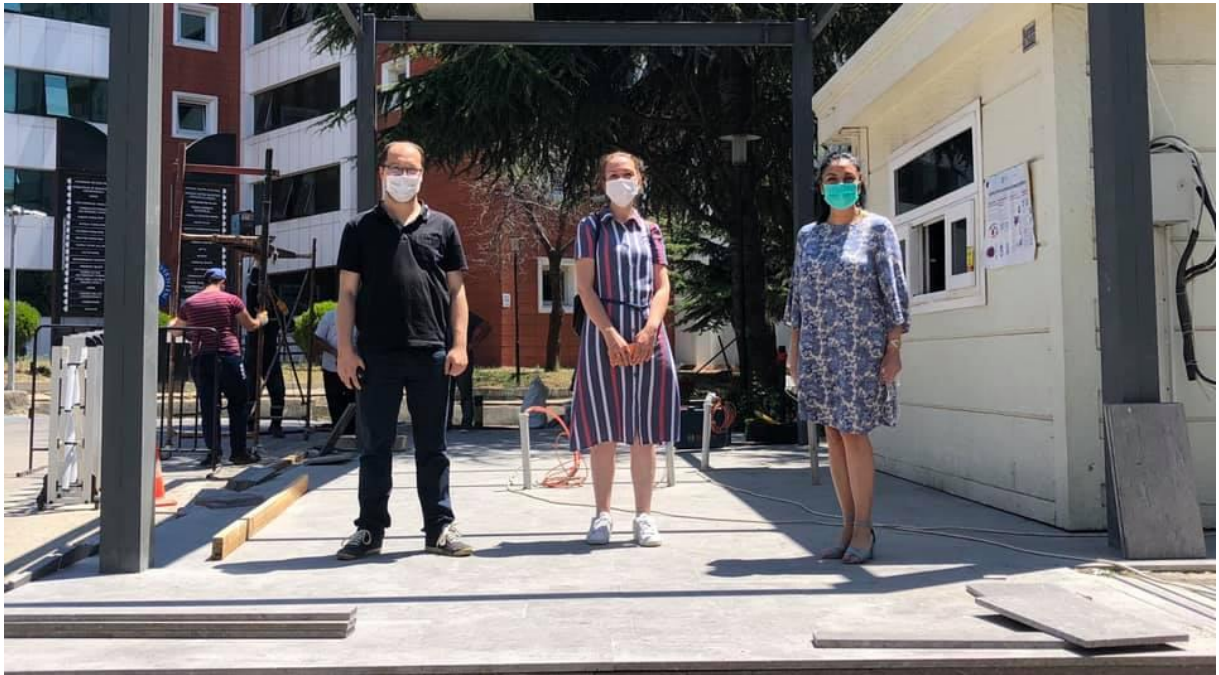
Erişilebilirlik Saha Çalışmasından Bir Kare