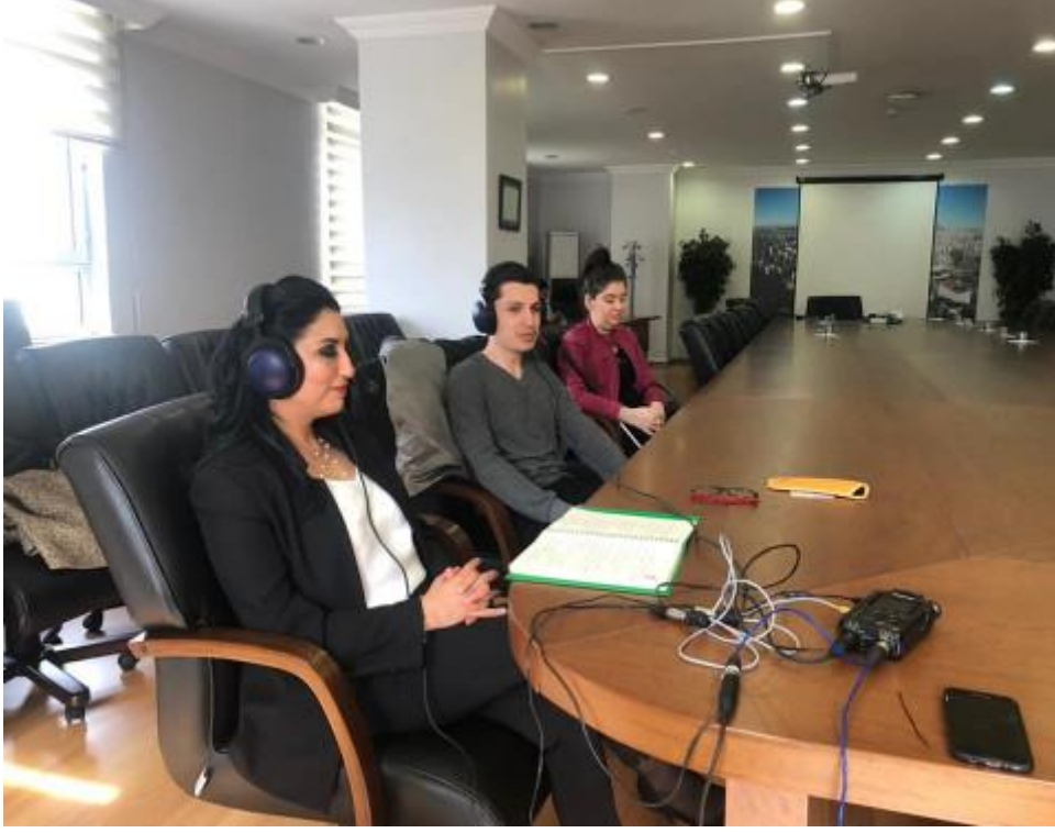
Engelsiz Sesler Radyo Programı-R6pportaj Eshnasında