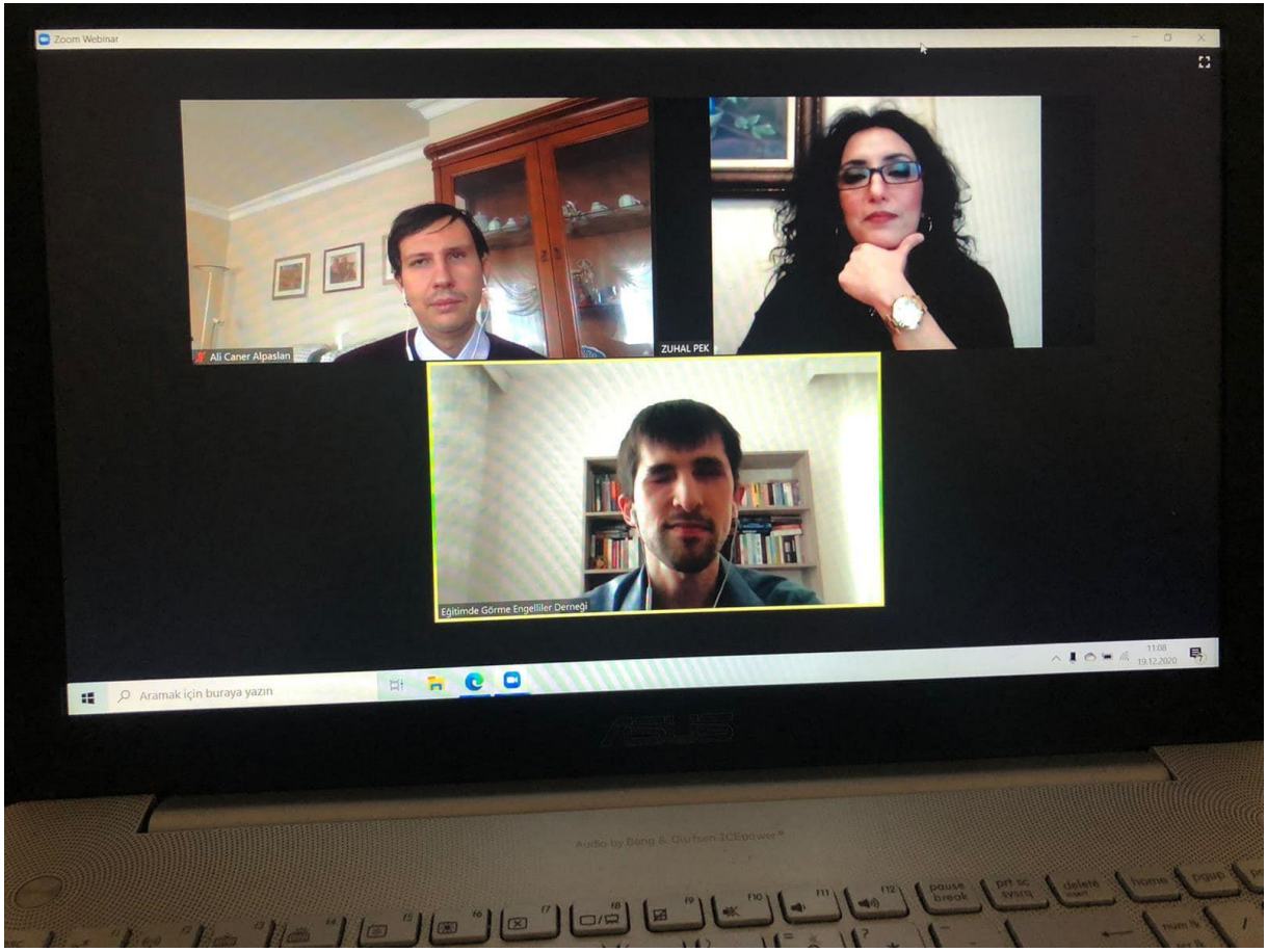
Görme Engellilerin Müzik Eğitimi Zirvesinden