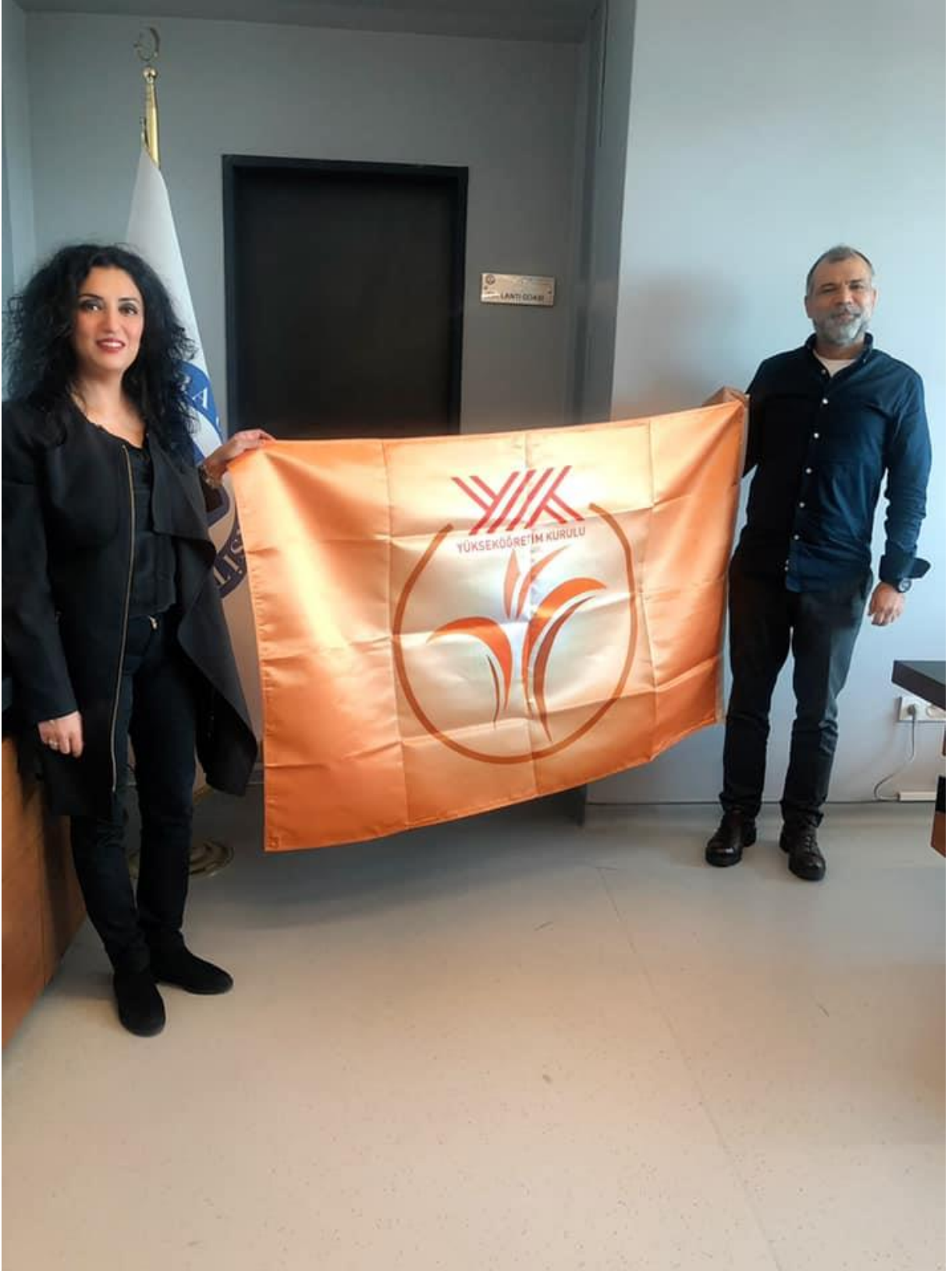
İşletme Fakültesi Mekânda Erişilebilirlik Ödülü