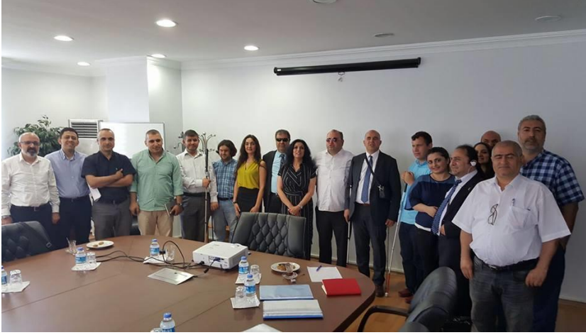
5-Goodfeel Nota Yazma ve Okuma Programı Kılavuzu Çevirmenlerine Teşekkür Belgesi Takdimi