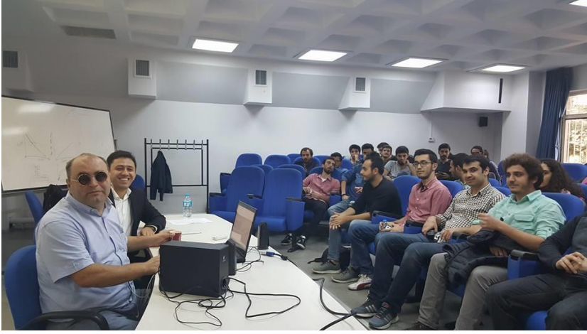
4-İstanbul Valiliği Bilişim Erişilebilirliği Komisyonu ile yapılan çalıştay